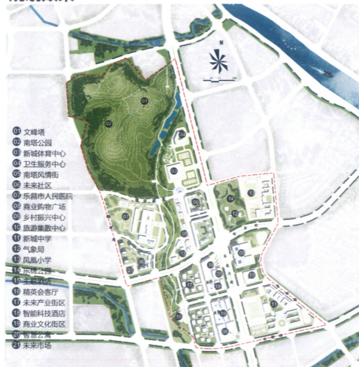
城市设计总平面图